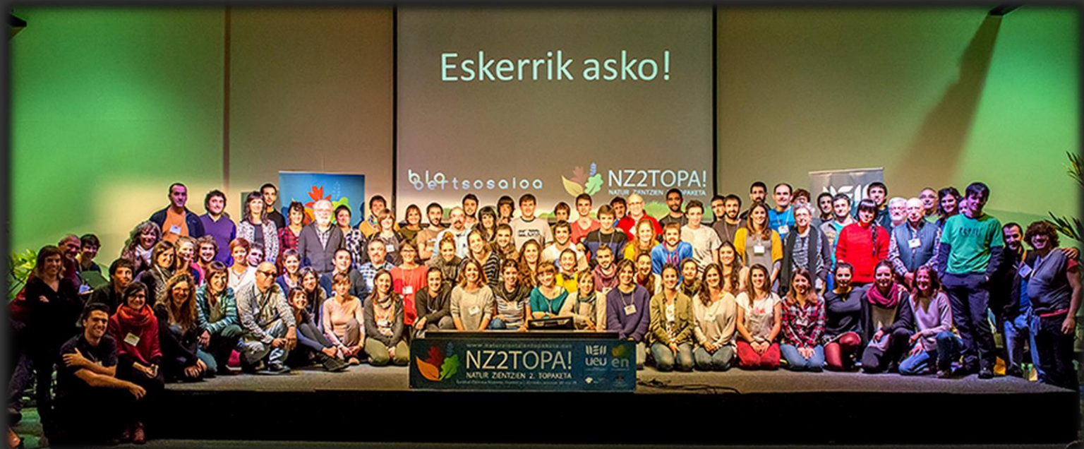
UEUko Natur Zientzien Saila eta EuskalNatura Elkartea (CC BY-SA 3.0)