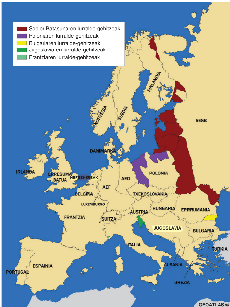
Iturria: Martínez Rueda, F. eta Urquijo Goitia, M. (2006): Materiales para la historia del mundo actual , Madril, Istmo, I., 105. or.