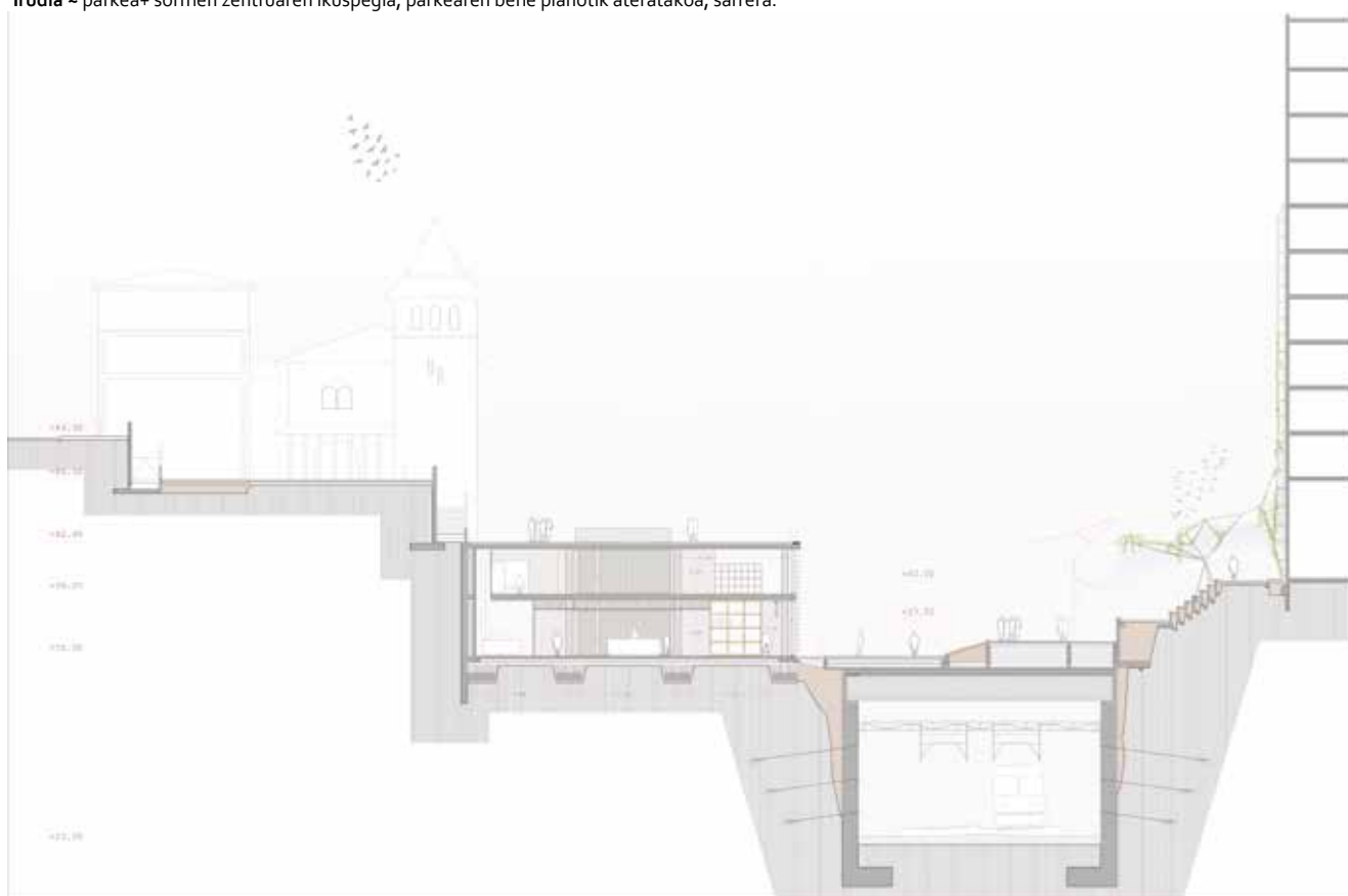
Irudia ~ zabala kalearen konexioa+ albo eraikinen irterak+ sormen zentrua+ parkea+ medianeretan aktuazioa.