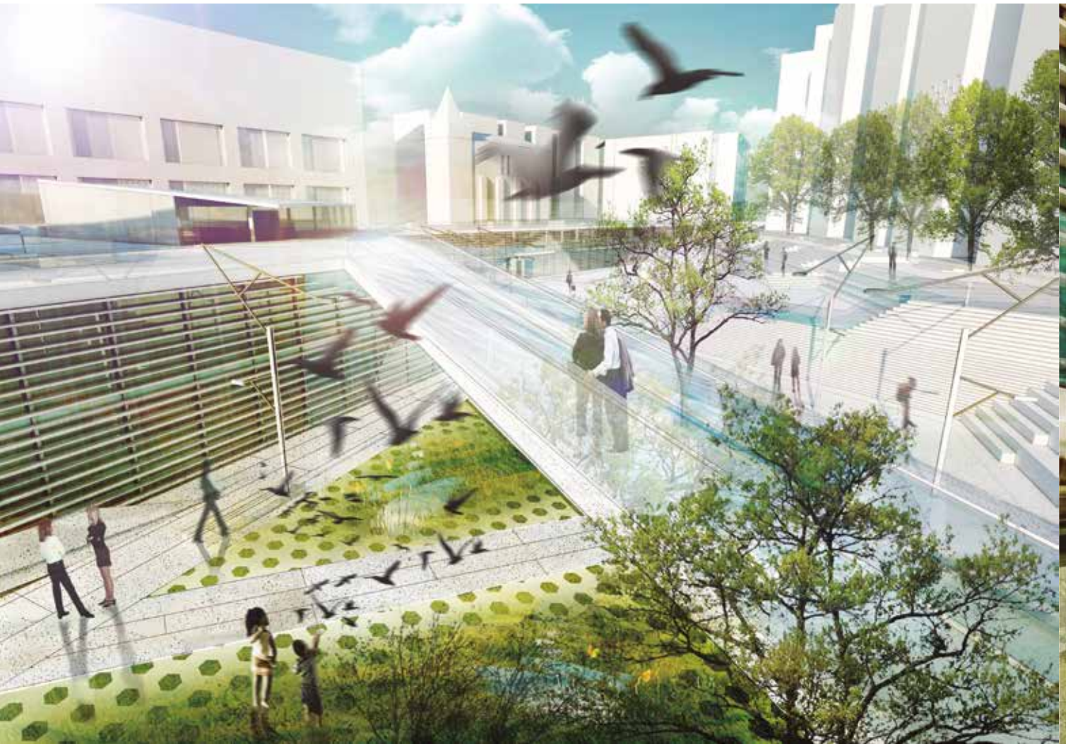
Irudia -sormen zentrua+ sarrera + parke urbanoaren 3 dimentsioak+ ibilbidea.

kontra itsatsia, inguruko etxeekin fusionatzen da, eta etxebizitzetzi patio berri bat eskaintzen die. Eraikineren bloke nagusiak bi altuera ditu, parkearen kotaren eta alboko kalearen arteko kota-diferentzia, hain zuzen. Horrela, eraikina goitik behera edo behetik gora uler daiteke, bi sarrera dituelako. Alde batetik, behean, parkearen kotan dagoen sarrera dago, parketik datozenentzat, ipar-hego ardatzaren erdialdean dagoena. Bestetik, goiko sarrera dago, 3. solairuaren kotan, eraikineren alboko kaletik datozenentzako sarrera. 2. solairuaren estalkia zapalgarria da, eta, beraz, eraikin osoa ibilgarria da, etxeentzako patioa.