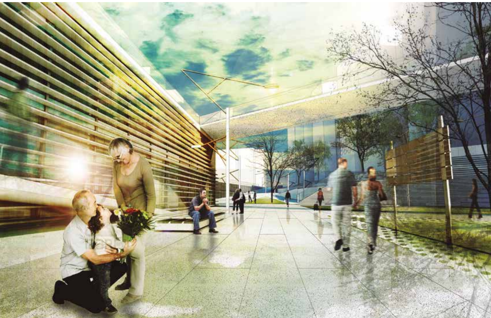
Irudia ~ parkea+ sormen zentruaren ikuspegia, parkearen behe planotik ateratakoa, sarrera.