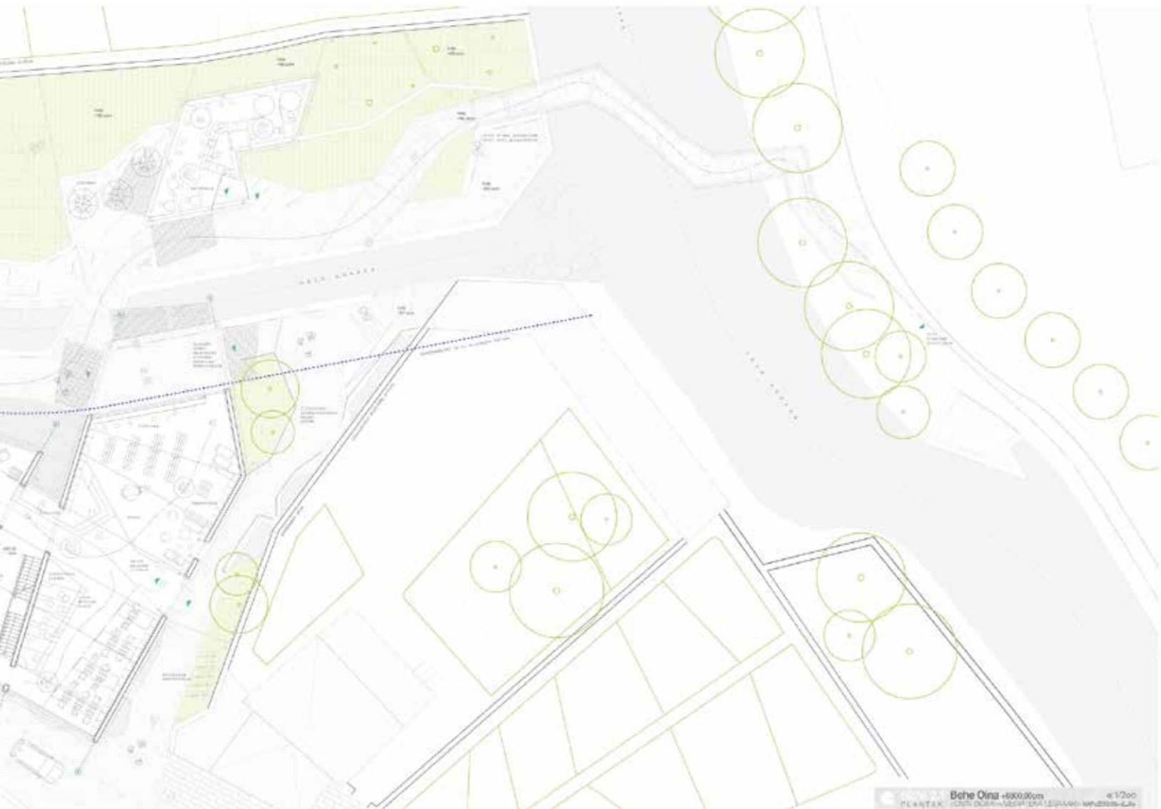
Irudia – Planta nagusia. Loteak eta ibilbideak herrira zabalduz