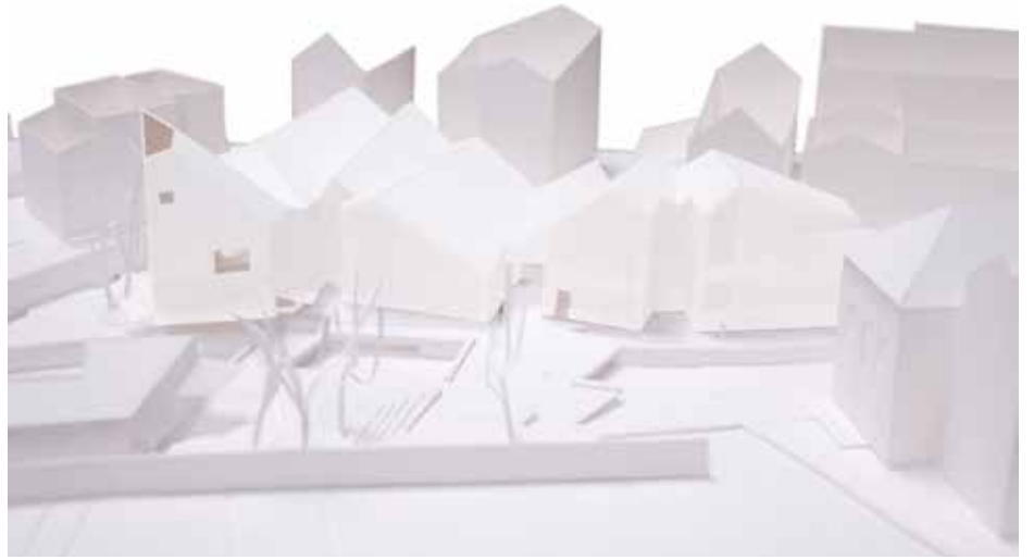
Irudia – Maketaren argazkia. Errekarantz irekitzen den mendebaldeko fatxadaren ikuspegia