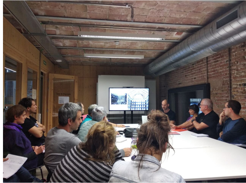
Irudiak - Euskal Herritik Bartzelonara joandako taldeak La Dinamoko formakuntza-saio batean.

ezinbestekoa da. Horretarako (Europako zein Europaz kanpoko) herrialde askotan aurrera eramaten diren politikak har ditzakete eredu gisa: lur-erreserbak eginez (Hanburgo eta Danimarkan egiten den bezala), finantzazio sozialak sustatuz (Uruguai, Berlin, Hanburgo, Quebec, Viena...) edota eredu honen aipaturiko berezitasunak barne hartzen dituen marko juridiko bat sortuz eta laguntza tekniko emanaz (Uruguai FUCAM, Britainia Handiko Community-led Housing Hubs edo Alemaniako Stattbau).