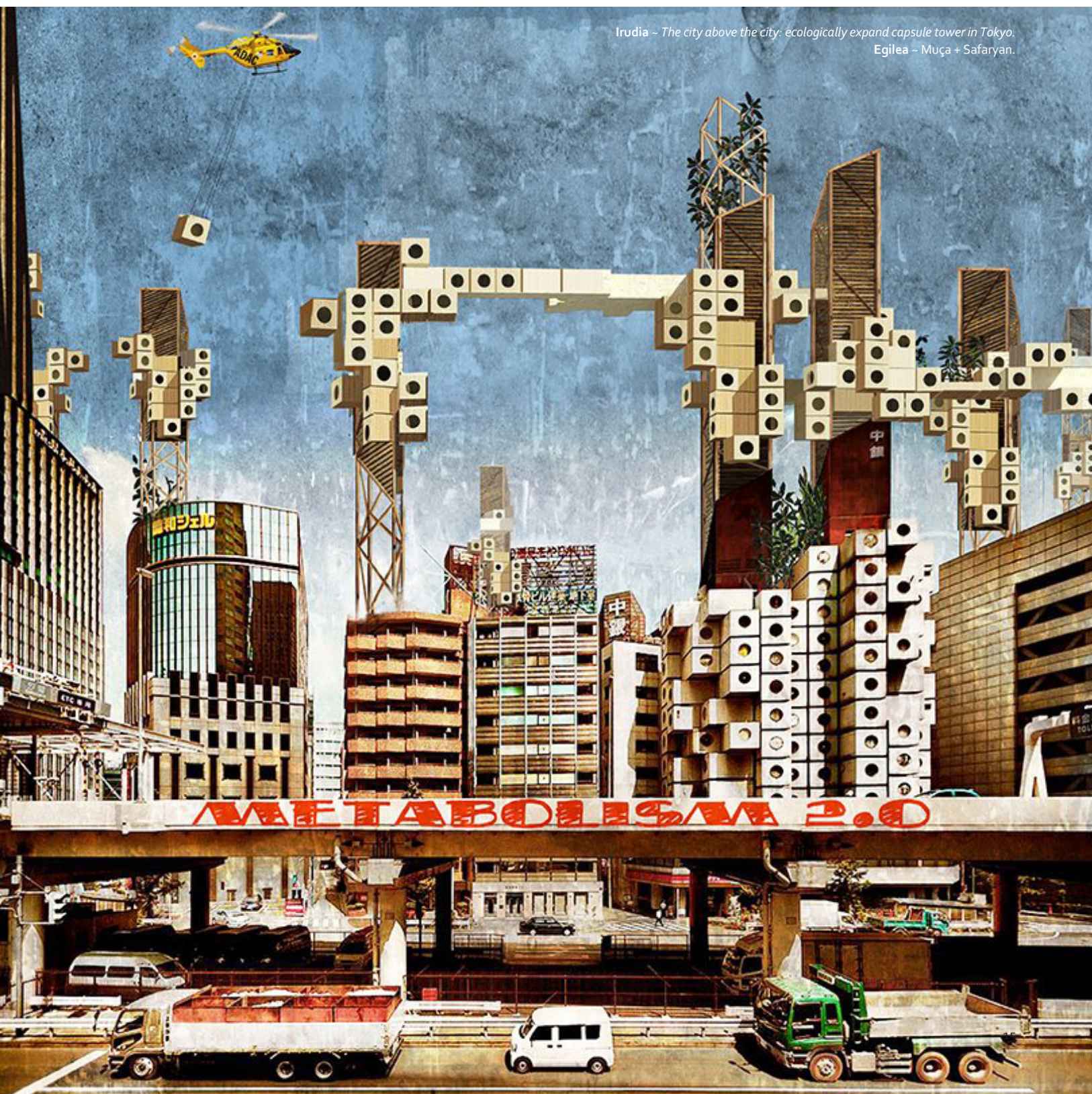
Irudia - The city above the city: ecologically expand capsule tower in Tokyo. Egilea - Muça + Safaryan.

Idea honek arkitektura garaikidean lekurik ez duen arren, ez dago gugandik hain urrun: etxebizitza bernakuluak —gure ohiko baserriak, esaterako— beharren arabera aldaketak jasateko ideia hartzen baitzuen bere gain.