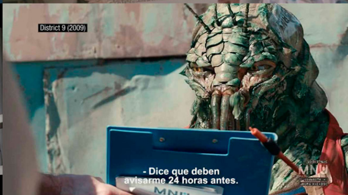
2. irudia ~ Hurrengo filmen fotogramak: "V" (1983), "The A Team" (1984), "The Goonies" (1985, Richard Donner), "District 9" (2009, Neill Blomkamp).