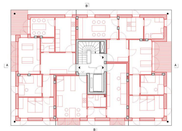
2. irudia ~ Grundbau und Siedler. Beltzez arkitektoek diseinaturiko euskarria. Gorriz, erabiltzaileek diseinatu eta eraikitako etxebizitzak.