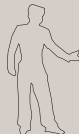
Gaizka Altuna Charterina

Keywords: control, production chain, shared economy, open building