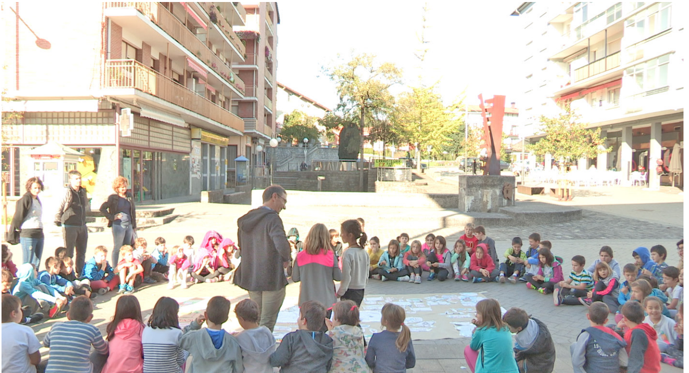
Irudia – Haurren lan-saioa, proposamenak. Egilea – Ibai Pujana Gurtubai.

identifikatu eta proposamenak egiteko aukera izan zuten herritarrek.